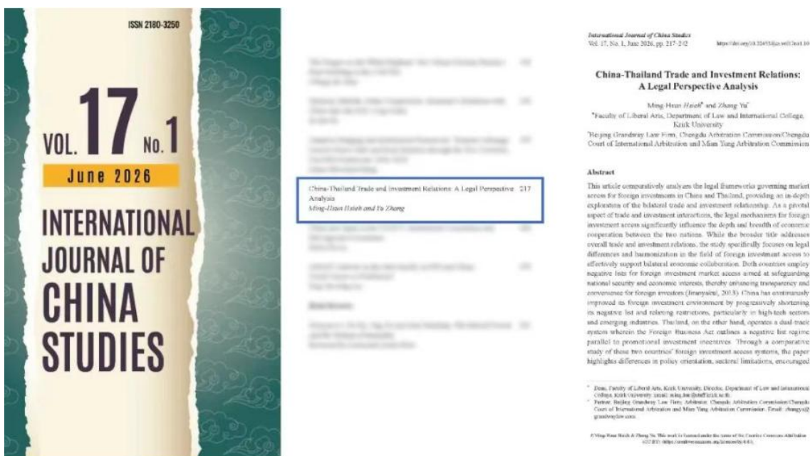
|| 期刊封面、目录及论文首页 ||

近日，国枫律师事务所成都办公室合伙人张宇律师撰写的论文“China-Thailand Trade and Investment Relations: A Legal Perspective Analysis”发表于国际学术期刊 International Journal of China Studies 。