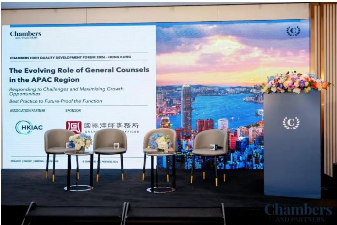
|| 论坛现场 ||