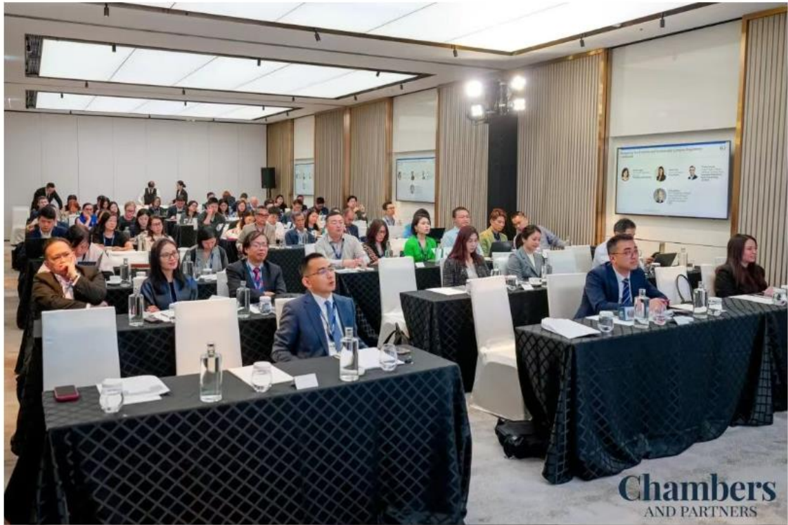
|| 论坛现场 ||