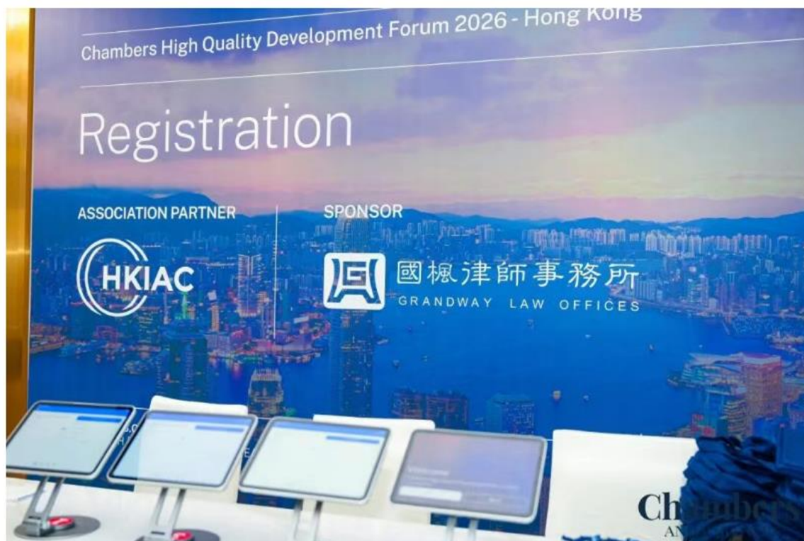
|| 论坛现场 ||