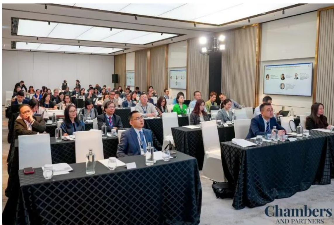
|| 论坛现场 ||