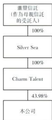
分派前 Charm Talent 的股權架構