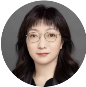
马 哲 执行合伙人 资本市场