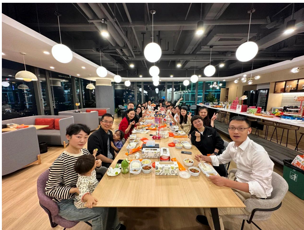
当中秋遇上亚运，心相融，爱未来。

本次活动在热烈的气氛中举行，也在欢声笑语中落下帷幕。活动放松了身心，营造了健康向上的文化氛围。通过彼此间的交流和沟通，增进了同事间的友谊，增强了团队的凝聚力和合作意识，同时也弘扬了中华传统文化，活跃了节日气氛。