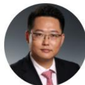
王冠 北京国枫(深圳)律师事务所 合伙人 业务专长 公司收购与兼并业务、公司证券业务 公司常年法律服务、国有资产法律业务