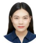
曲艺 北京国枫(深圳)律师事务所 律师 业务专长 公司证券业务